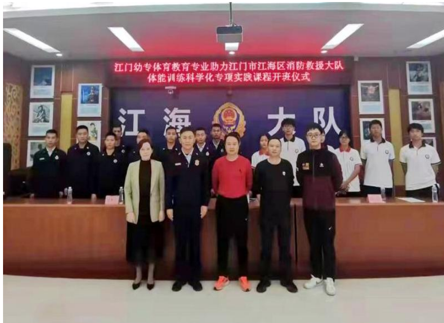
江门市江海消防队员体能训练专项课程开班仪式