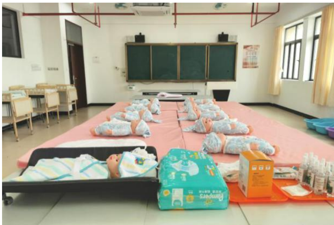
1+X 幼儿照护（中）职业技能等级认定考核现场布置

学校深入推进学分认定制度，制定《广东江门幼儿师范高等专科学校学生学分认定与转换管理办法》，学前教育专业按照相关要求优化人才培养方案，开设《幼儿照护》专业选修课，将证书标准有机融入《学前儿童卫生与保健》