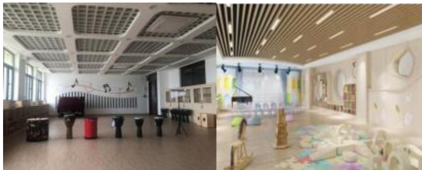
奥尔夫音乐实训室

完善了音乐厅音响灯光调控台、舞蹈室多媒体、声乐教室合唱台阶等教学设施的建设；制定了刷卡机预约流程、音乐厅及各类功能室的申请流程；完善了数码钢琴室、舞蹈实训室、教师琴房、学生琴房等实训室的管理制度，规范教学实训管理，为教学提供了坚实的保障，不断提高管理成效。经过多次的外出考察与论证，体育教育专业制定了详细的功能室建设方案，功能室主要包含大学生体测中心、综合健身房、体能训练综合馆、体操房、瑜伽馆、跆拳道馆等功能房。目前各类功能室建设正有序推进，为教学改革与创新提供有力保障。