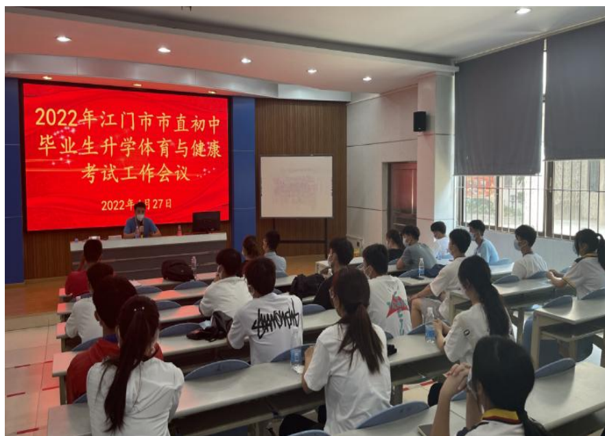
江门幼专体育教育系学生参加体育中考测评培训