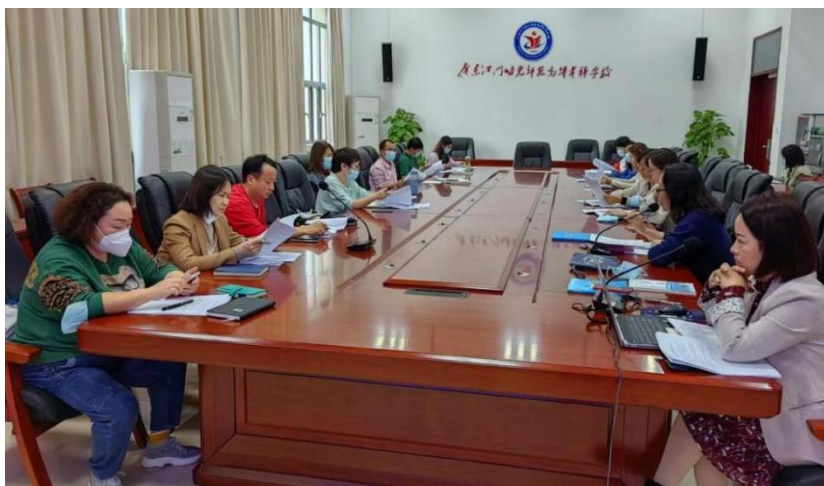
专业教师在热烈讨论人才培养方案的调整

人数为历年最多。以“提质”为核心，以就业为导向，以职业道德和职业素养教育为重点，坚持知行合一、工学结合的人才培养特点，致力于培养大批适应学前教育事业发展需求的复合型高技能高素质人才。