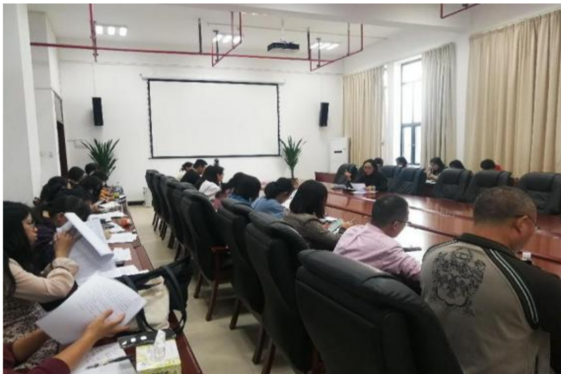
图 1 实习指导老师培训会议

(二) 各系部建立指导教师制度，严格实习教师指导量化指标，切实加强学生实习期间的指导和日常巡视。学生实习结束时，各系部要召开实习总结大会，总结在实习过程出现的不足。