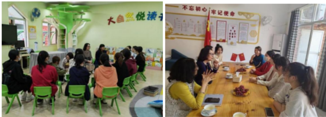
图 2-3 系部领导下园巡查

(二) 各系部建立指导教师制度，严格实习教师指导量化指标，切实加强学生实习期间的指导和日常巡视。学生实习结束时，各系部要召开实习总结大会，总结在实习过程出现的不足。