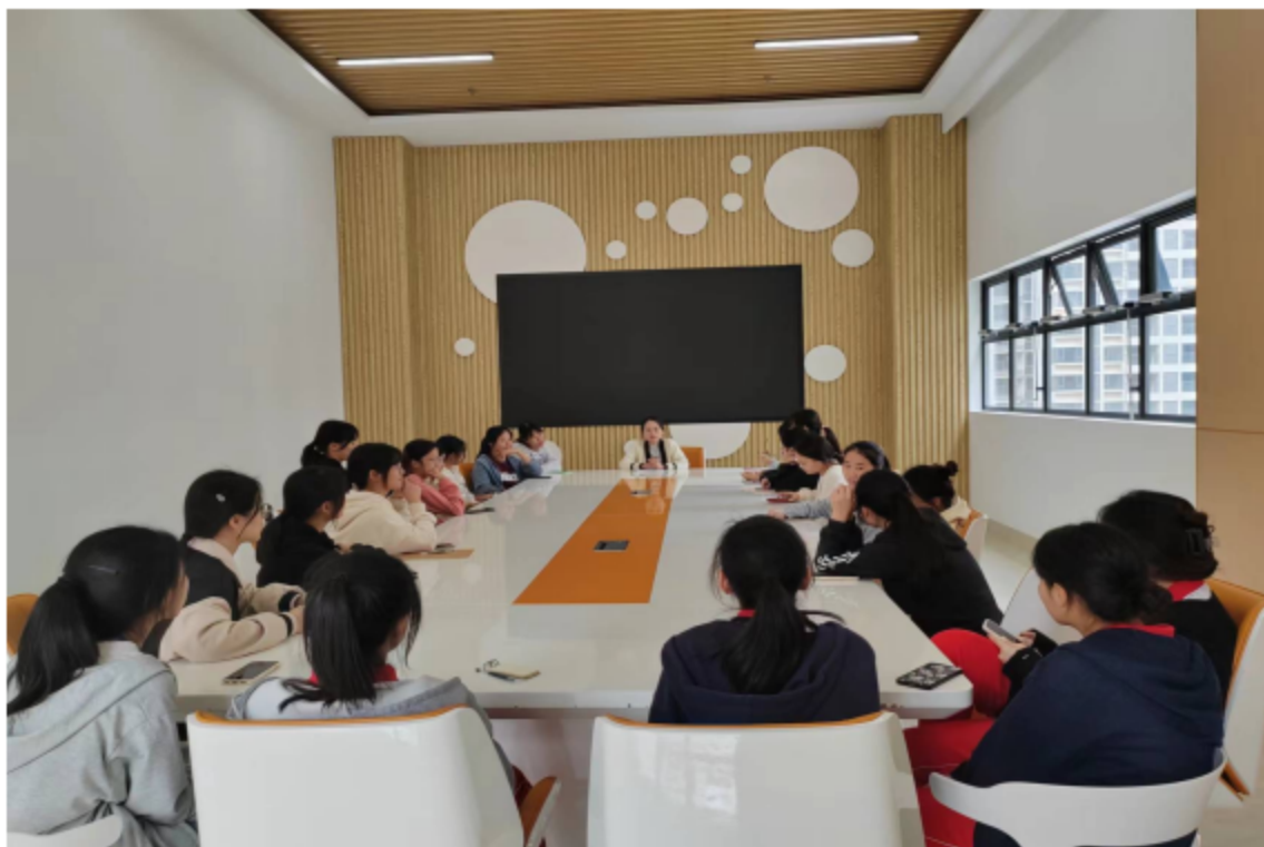
图4 学校教务部下园巡查